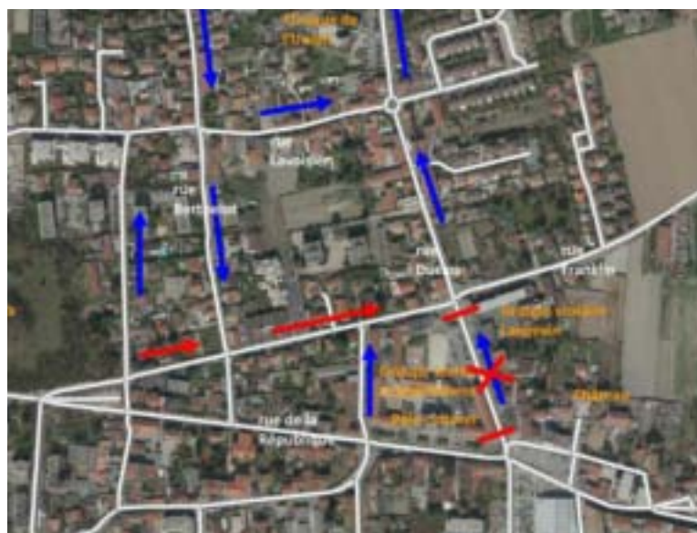
Le plan de circulation au Village pendant les travaux rue Duclos.

CETTE fermeture, obligatoire, permettra à la direction de l'eau du Grand-Lyon de réaliser les grilles d'eaux pluviales, et à la direction de la voirie de reprendre le trottoir ouest ainsi que la chaussée, de poser les nouveaux enrobés et les bordures de piste cyclable. Une déviation avec une signalisation adaptée est mise en place pour l'ensemble des véhicules. Le sens de circulation de la rue Franklin est inversé pendant cette période entre les rues Lakanal et Duclos. Tous les véhicules, dont les bus 7 et 83, emprunteront cette rue pour rejoindre le nord du Village. Le parking Grandclément sera ouvert depuis la rue Franklin. En complément de la fermeture de la rue Duclos entre le 26 août et le 11 octobre 2013, la rue Franklin sera fermée ponctuellement à la circulation des véhicules pendant une semaine du 26 au 30 août, sur la section rue Duclos et chemin de la Colombière. Cette fermeture permettra à la direction de l'eau du Grand-Lyon de réaliser des raccordements de grilles d'eaux pluviales. Des déviations seront mises en place pour permettre aux riverains d'accéder à leur domicile, notamment par la rue Jean-Jaurès et la rue du Rhône.