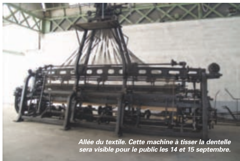
Allée du textile. Cette machine à tisser la dentelle sera visible pour le public les 14 et 15 septembre.