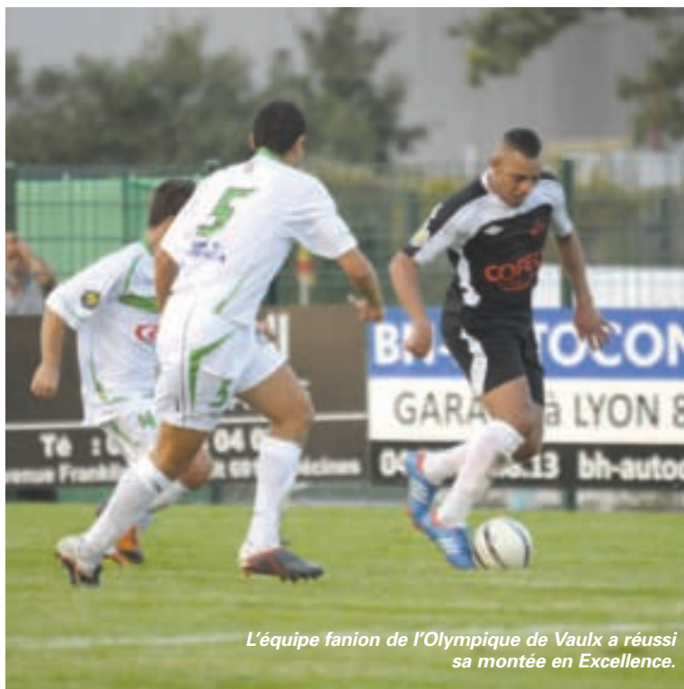
L'équipe fanion de l'Olympique de Vaulx a réussi sa montée en Excellence.

Pratique : Olympique de Vaulx-en-Velin, stade Ladoumègue, avenue Gabriel-Péri. Renseignements et inscriptions en semaine, sur place, de 18h à 19h30. Tél : 04 78 80 61 69.