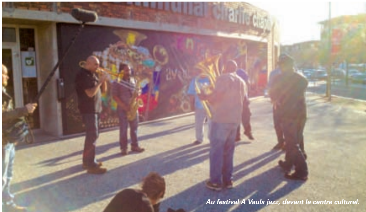
Au festival A Vaulx jazz, devant le centre culturel.