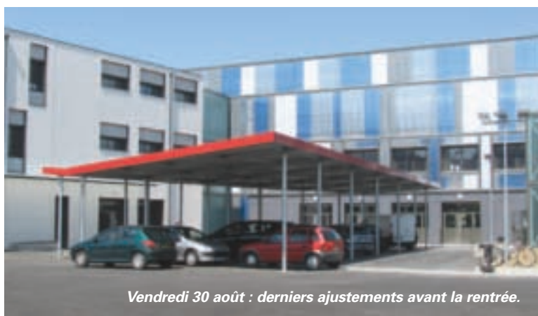
Vendredi 30 août : derniers ajustements avant la rentrée.

Le nouveau bâtiment gardera une identité architecturale avec des tons