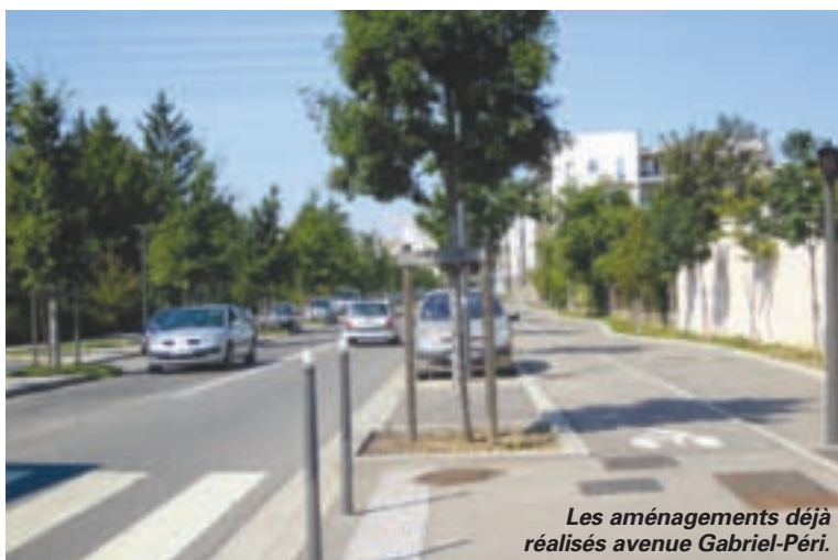
Les aménagements déjà réalisés avenue Gabriel-Péri.

est financé par le Grand-Lyon (6,7 millions d'euros), par l'Agence nationale pour la rénovation urbaine (3,9 millions d'euros) et la Ville participe à hauteur de près de 600 000 euros pour l'éclairage. La maîtrise d'œuvre a été confiée à Egis France et le projet architectural à Marc Pelosse. Deux tronçons importants sont donc en cours de réalisation depuis la fin du mois de juillet : l'avenue Gabriel-Péri entre les avenues Lefèvre et Picasso, et l'avenue Salvador-Allende entre la rue Maurice-Audin et l'avenue Paul-Marcellin. Il s'agit de réduire la voirie à deux fois une voie de circulation, de créer couloirs d'approche aux feux pour les bus, de mettre en place du stationnement le long de l'avenue, d'élargir les trottoirs et de sécuriser les traversées piétonnes et d'en créer de nouvelles (notamment impasse Lefèvre et rue du Mail), de créer des