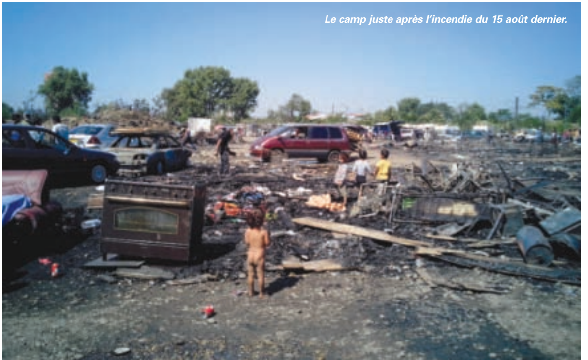
Le camp juste après l'incendie du 15 août dernier.

"L'expulsion du camp de Vaulx-en-Velin était devenue inéluctable pour faire cesser cette situation intolérable, a com-